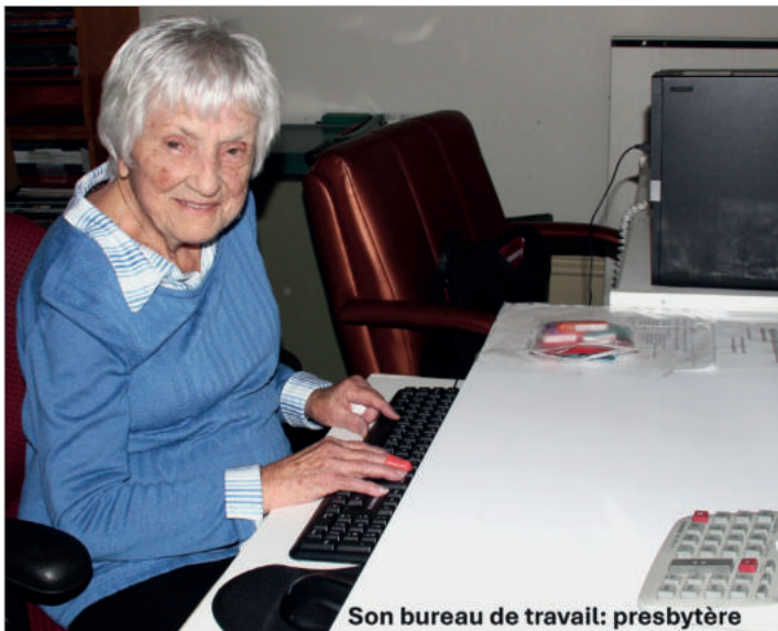
Son bureau de travail: presbytère