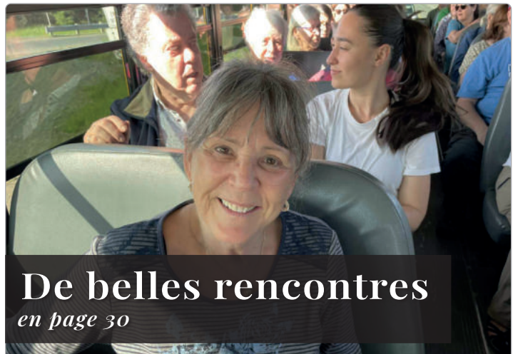
De belles rencontres